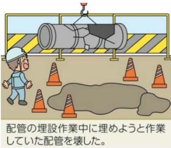
配管の埋設作業中に埋めようと作業していた配管を壊した。