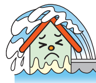
地震が原因の津波